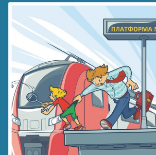
Платформа - не место для игр!