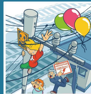
Приближаться к проводам меньше чем на 2 метра - смертельно опасно!