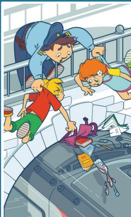
Поезд на крышах и подножках поездов - может стоить жизни!